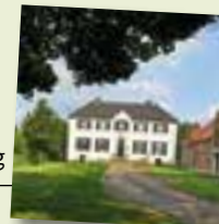
Haus Lohn, Südlohn