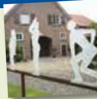
Glasmuseum, Lette