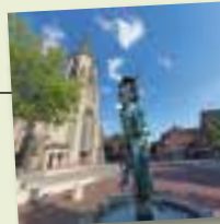
Stadtlohn Brunnen