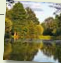
Berkelsee, Gescher