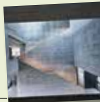
„kult“ Vreden

Weitere Ausflugstipps, Vorschläge für Rad- und Wandertouren sowie Picknick-Tipps finden Sie auf muensterland.de und muensterland.com .